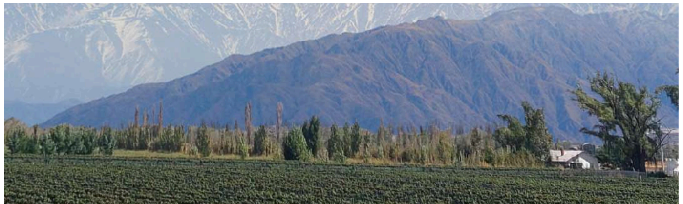
Cuchillo de Palo Malbec