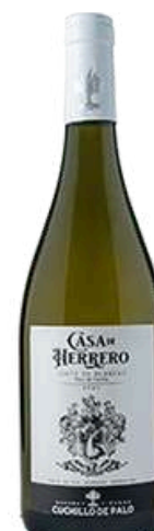
Casa de Herrero Rosé